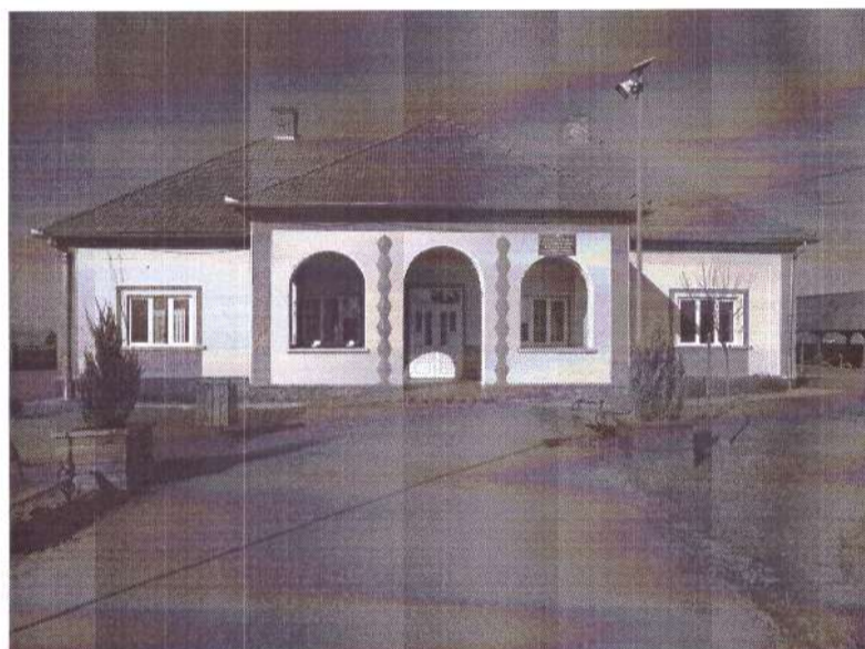
Căminul Cultural al Comunei Ciumești

(3) Comuna Ciumești dispune de un cămin cultural fiind situat în centrul comunei, clădirea este renovată și amenajată cu bucătărie care este dotată cu toate utilitățile inclusiv cameră frigorifică, iar în sala mare se organizează diferite activități culturale, având o capacitate de aprox. 300 locuri.