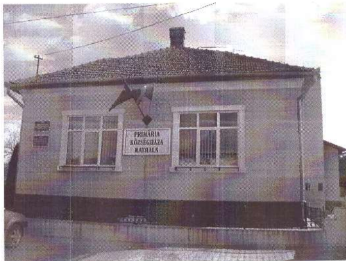
Primăria Comunei Ciumești