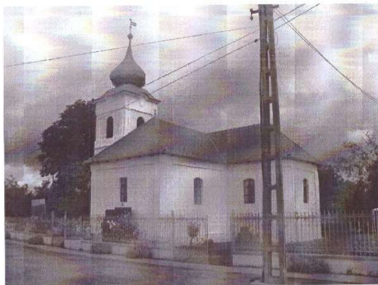
Biserica Reformată Berea

(3) Vechea biserică reformată a fost construită în secolul al XV-lea, în stil gotic, fără turn, iar clopotnița din lemn a fost ridicată în secolul al XIX-lea. Biserica actuală este de origine medievală, cu altar poligonal și colțurile exterioare prevăzute cu contraforturi. Modificări radicale s-au realizat în special la nivelul ferestrelor, total refăcute. De asemenea, tavanul actual este plat, iar spațiul interior este divizat de un arc de triumf. Nu se mai păstrează nimic din mobilierul vechi al bisericii, cu excepția amvonului din piatră. Acoperământului amvonului a fost realizat, după o inscripție, în anul 1763, de către Zsigmond din familia Csomaközy, familie de la care s-a preluat și numele satului. În urma cutremurului din 1834, biserica a necesitat mai multe reparații și modificări care, potrivit unei inscripții, au constat, printre altele, în înlocuirea acoperământului de amvon (1841). Este posibil ca zidul de incintă, astăzi distrus, să fi fost realizat tot în perioada medievală. Turnul din lemn adosat în partea de vest a navei a fost construit în 1831 și este folosit ca hol de intrare. Nu se mai păstrează clopotele.