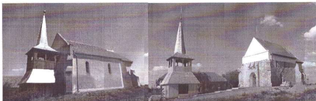
Biserica veche reformată

(3) Vechea biserică reformată a fost construită în secolul al XV-lea, în stil gotic, fără turn, iar clopotnița din lemn a fost ridicată în secolul al XIX-lea. Biserica actuală este de origine medievală, cu altar poligonal și colțurile exterioare prevăzute cu contraforturi. Modificări radicale s-au realizat în special la nivelul ferestrelor, total refăcute. De asemenea, tavanul actual este plat, iar spațiul interior este divizat de un arc de triumf. Nu se mai păstrează nimic din mobilierul vechi al bisericii, cu excepția amvonului din piatră. Acoperământului amvonului a fost realizat, după o inscripție, în anul 1763, de către Zsigmond din familia Csomaközy, familie de la care s-a preluat și numele satului. În urma cutremurului din 1834, biserica a necesitat mai multe reparații și modificări care, potrivit unei inscripții, au constat, printre altele, în înlocuirea acoperământului de amvon (1841). Este posibil ca zidul de incintă, astăzi distrus, să fi fost realizat tot în perioada medievală. Turnul din lemn adosat în partea de vest a navei a fost construit în 1831 și este folosit ca hol de intrare. Nu se mai păstrează clopotele.