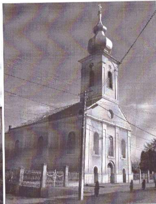
Biserica romano-catolică “Sf. Rege Ștefan”