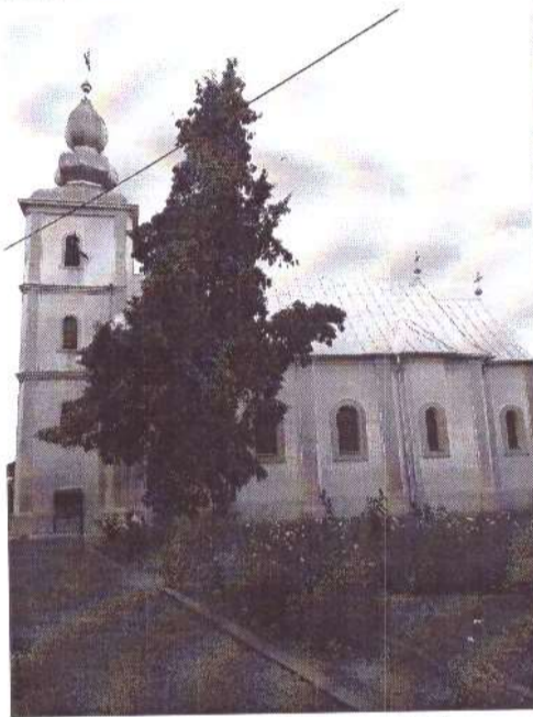
Biserica ortodoxă Sf. Arhangheli Mihail și Gavril

(2) Denumirea lăcașelor aparținând cultelor religioase prevăzute la alin. (1) sunt: Biserica romano-catolică “Sf. Rege Ștefan”, Biserica ortodoxă Sf. Arhangheli Mihail și Gavril, Biserica Reformată Berea.